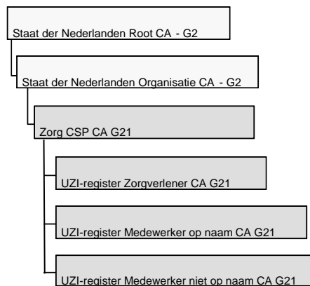
Figuur 2 CA-model SHA-2 generatie (G21)

De SHA-2 (G21) hiërarchie is per 22 maart 2020 verlopen. Deze hiërarchie maakt gebruik van een cryptografisch algoritme SHA-2 bij ondertekening van certificaten en CRL's. Deze structuur is weergegeven in Figuur 2 CA-model SHA-2 generatie (G21)